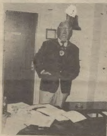
Gradonačelnik gosp.w.A.McKenzie iz Fremantla pozdravlja sve prisutne uzvanike na svečanom primanju u Town Hallu

Za nas je ovo izvanredna čast, osobito u ovim danima kada mi slavimo 150 godina obstanaka naše države, Zapadne Australije, koja je prije 150 godina postala slobodna država u sklopu austral-ske federacije.